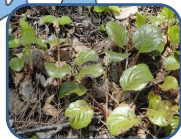
⑤ペニバナイチヤクソウ