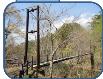
④裏磐梯唯一の吊り橋