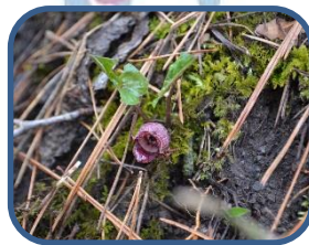
②トウゴクサイシン