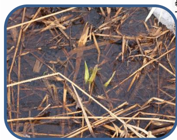
①ミズバショウの芽