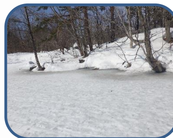
②溶け始めたレンゲ沼