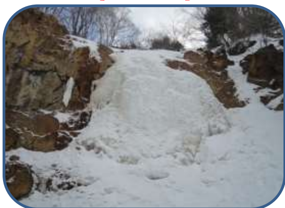
⑤イエローフォール レモンイエローが新鮮でした。