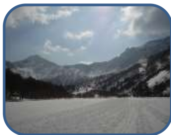
②氷結した銅沼の上を歩きます。