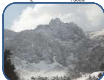
④荒々しい印象の天狗岩

裏磐梯ビジターセンター (福島県耶麻郡北塩原村) TEL: 0241-32-2850 開館時間: 9:00~16:00 (12~3月) 休館日: 毎週火曜日(祝日の場合、翌日が振替休館)