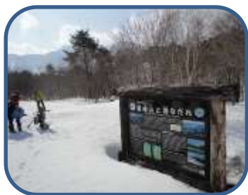
①グレンデ上部から歩き始めます。