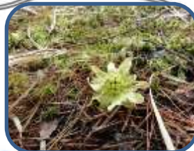
⑥春の使者フキノトウ