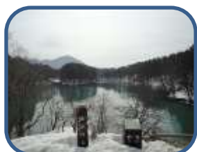
①毘沙門沼展望台より