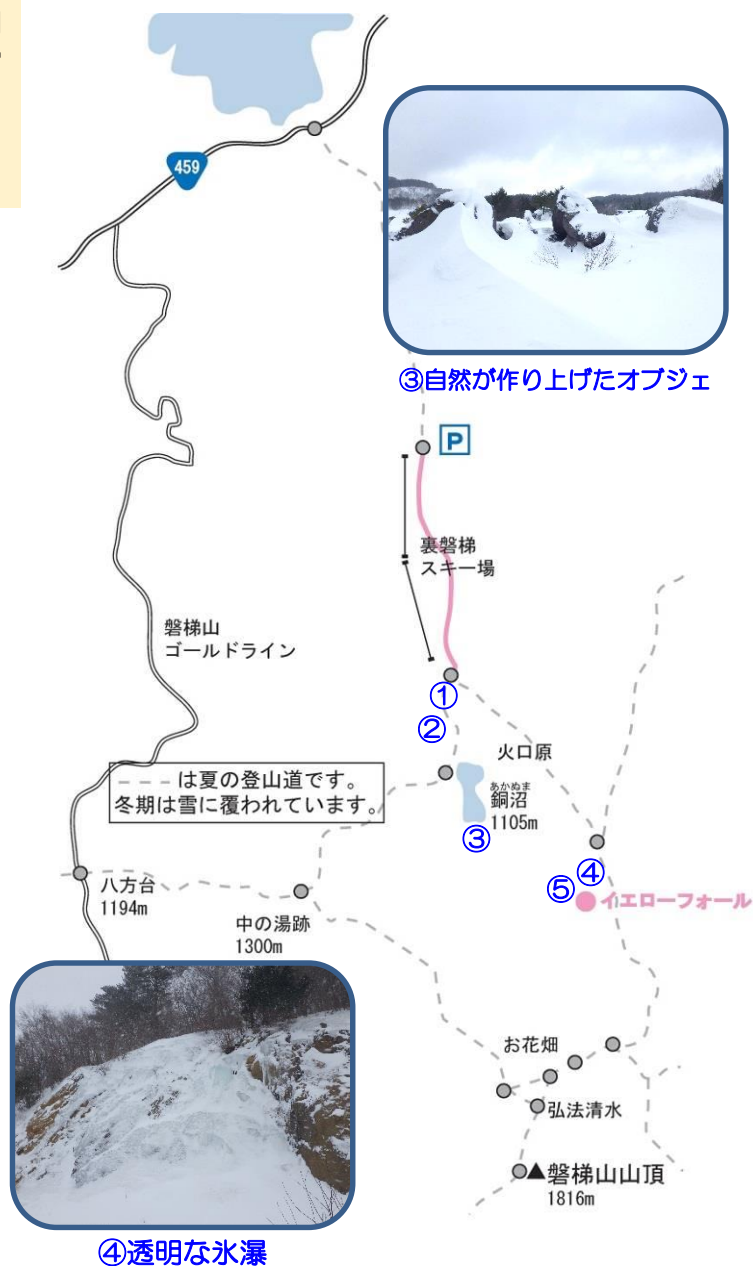
③自然が作り上げたオブジェ

特徴：特に定まったコースはなく、案内板や道標などもない（夏道を示すものはあるが、おおそ雪の下）。気象状況によってトレース（踏み跡）も消えることが多いため、各自、地図やコンパス等で、ルートを探さなければならない。