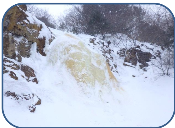
⑤イエローフォール きれいな色をしていました。

裏磐梯ビジターセンター（福島県耶麻郡北塩原村） TEL：0241-32-2850 開館時間：9：00～16：00（12～3月） 休館日：毎週火曜日（祝日の場合、翌日が振替休館）