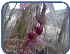
②ツルリンドウの実