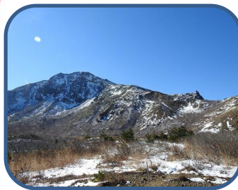
⑤ 沼ノ平からの山頂