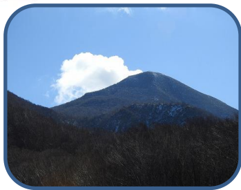
① 噴煙を上げているような旗雲