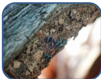
③ロクショウグサレキン