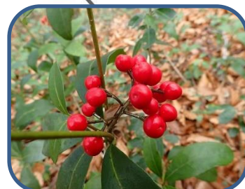
④ミヤマシキミの実