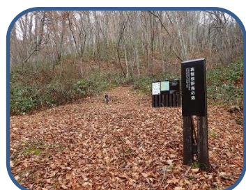
①松原・細野パノラマ探勝路 松原口

特徴：松原地区から南に延びる尾根筋を通り、「裏磐梯野鳥の森探勝路」の展望台へ向かうコース。ブナやミズナラ、トチノキ、カエデなどの広葉樹の森が広がり、樹林の切れ目からは、西吾妻山や松原湖の眺望を楽しむことができる。探勝路は、自然(山)の中のコースです。山歩きのできる用意をしましょう。