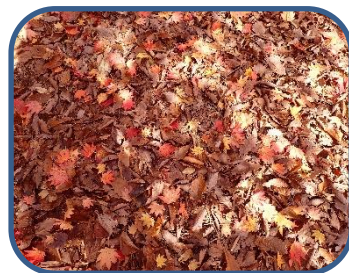
④紅葉のじゅうたん