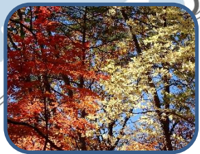
⑤紅白の競演 (ハチカゲ と コシアブラ)