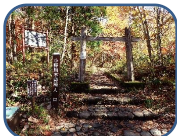
①小野川不動滝探勝路入口