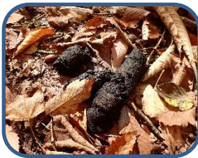
⑥ツキノワグマのフン