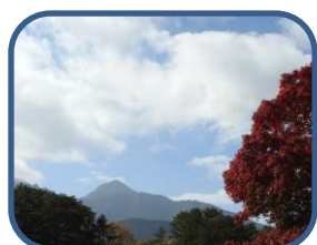
①毘沙門沼から磐梯山