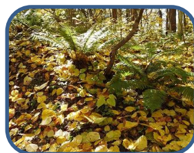
③ヒトツバカエデの絨毯