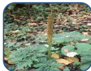
②ハナワラビの仲間