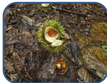
⑤ニホンザルの食痕だと思われるもの