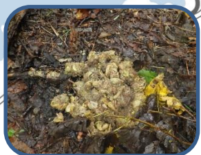
⑥ツキノワグマの糞