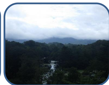
⑥中瀬沼展望台からの景色