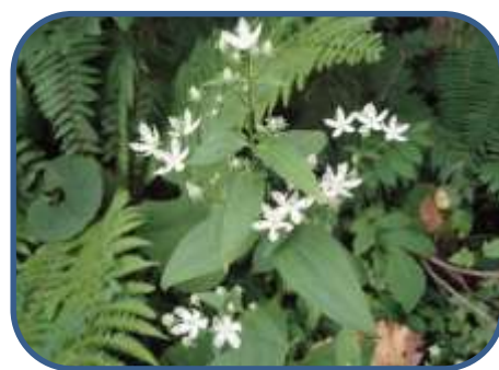
④アケボノソウ 初秋の花がきれいです。