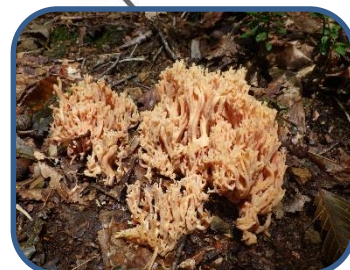
⑤ホウキタケの仲間