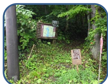
①松原・細野パノラマ探勝路 松原集落口

特徴：松原地区から南に延びる尾根筋を通り、「裏磐梯野鳥の森探勝路」の展望台へ向かうコース。ブナやミズナラ、トチノキ、カエデなどの広葉樹の森が広がり、樹林の切れ目からは、西吾妻山や松原湖の眺望を楽しむことができる。探勝路は、自然(山)の中のコースです。山歩きのできる用意をしましょう。