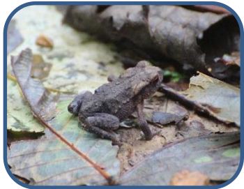
④アズマヒキガエル