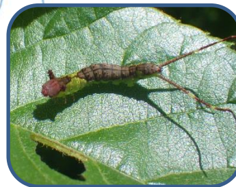
④ナカグロモクメシャチホコの 幼虫