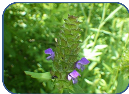
⑤ウツボグサ 咲き始めでした。