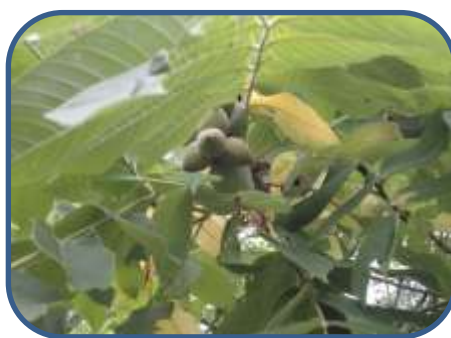
①オニグルミ 実をつけてきました。