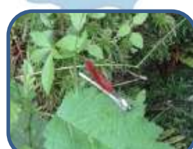
⑧ニホンカワトンボ

裏磐梯ビジターセンター(福島県耶麻郡北塩原村) TEL: 0241-32-2850 開館時間: 9:00~17:00(4~11月) 休館日: 毎週火曜日(祝日の場合、翌日が振替休館)