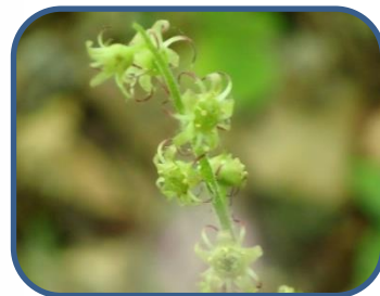
⑤コチャルメルソウ