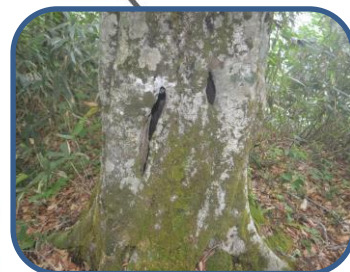
③コノハスクのようなブナ