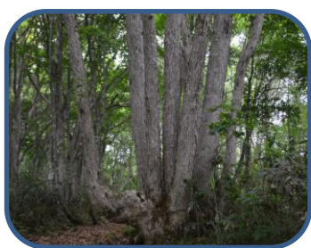
①ヤマタノオロチのようなミズナラ

特徴：松原地区から南に延びる尾根筋を通り、「裏磐梯野鳥の森探勝路」の展望台へ向かうコース。ブナやミズナラ、トチノキ、カエデなどの広葉樹の森が広がり、樹林の切れ目からは、西吾妻山や松原湖の眺望を楽しむことができる。探勝路は、自然(山)の中のコースです。山歩きのできる用意をしましょう。