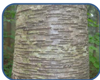
④ウダイカンバの洗濯板