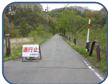
① サイクリングロードは通行止めです。