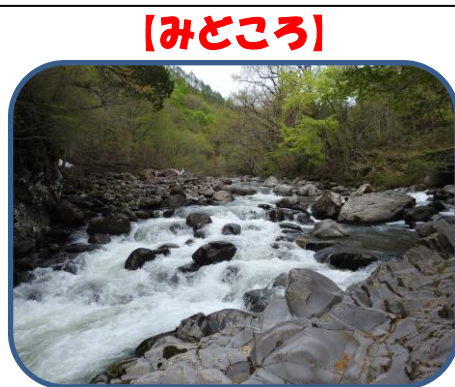
⑥ 中津川の流れ 水の流れは哲学です。

裏磐梯ビジターセンター（福島県耶麻郡北塩原村） TEL：0241-32-2850 開館時間：9：00～17：00（4～11月） 休館日：毎週火曜日（祝日の場合、翌日が振替休館）