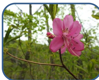
② トウゴクミツバツツジ

特徴：秋元湖に流れ込む中津川に沿ったコース。広葉樹の森の中を川の音や鳥の囀りを聞きながら歩けます。秋には紅葉が見事です。探勝路は、自然(山)の中のコースです。山歩きのできる用意をしましょう。