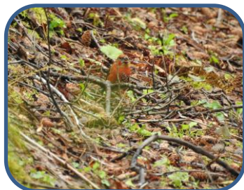
② イスカ (オス)