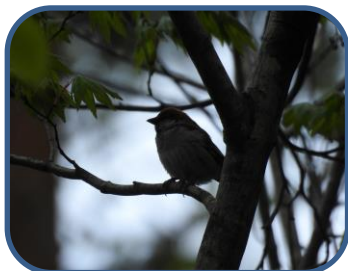
① ニュウナイスズメ

※最近ツキノワグマの目撃情報があります。クマ鈴をつけるなどして人間の存在を知らせてあげてください。目撃しましたら、ビジターセンターにお知らせください。