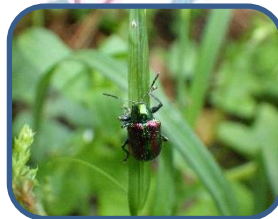
⑦アカガネサルハムシ