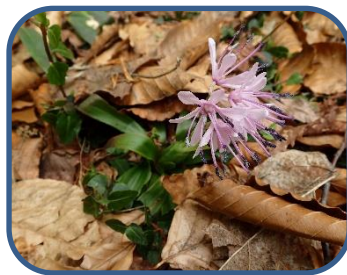
⑤ショウジョウバカマ

裏磐梯ビジターセンター（福島県耶麻郡北塩原村） TEL：0241-32-2850 開館時間：9：00～17：00（4～11月） 休館日：毎週火曜日（祝日の場合、翌日が振替休館）