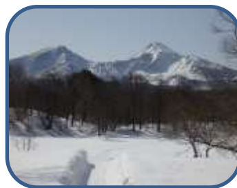
①レンゲ沼と磐梯山

特徴：比較的なだらかなコースです。鳥の囀りや沼越しの磐梯山などを楽しめます。探勝路は、自然(山)の中のコースです。山歩きのできる用意をしましょう。