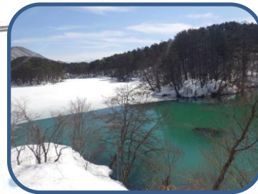
①毘沙門沼の西の展望台より