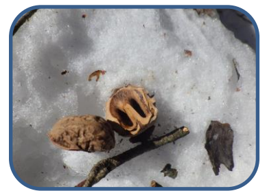
④ニホンリスの食痕