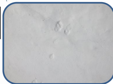
①ニホンノウサギの足跡