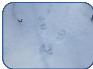
③ニホンリスの足跡