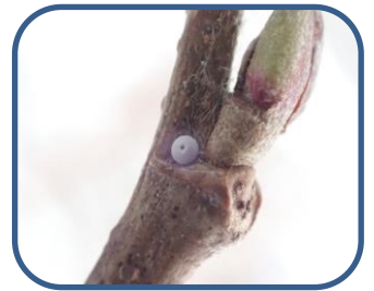
⑥ミドリシジミの卵