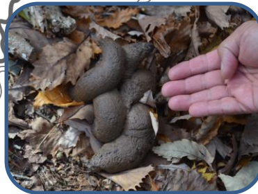
④新しいクマのフン