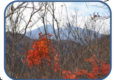
②カエデの向こうに磐梯山

ミズナラなどの森の中にある小野川不動滝は、落差約30mの涼しさ満点の美しい滝です。