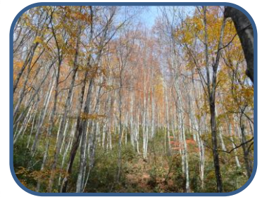
③明るい広葉樹の林