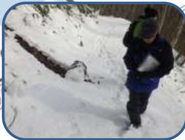
③脇からスノーロールが...