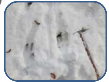
②ニホンカモシカの足跡