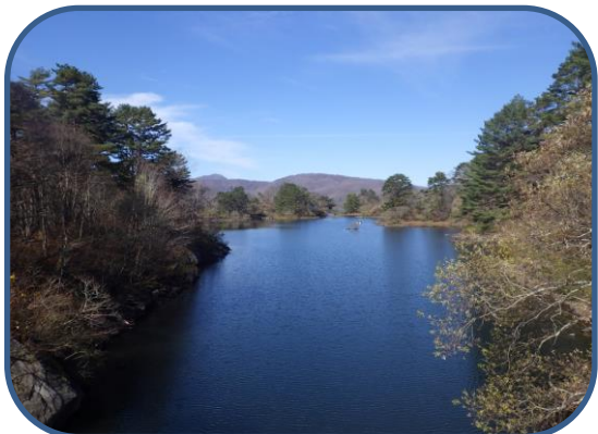
②吊り橋から眺める桧原湖 絶景が見渡せます。