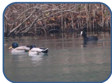
①マガモとオオバン