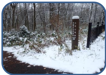
①早稲沢浜探勝路入り口

※最近ツキノワグマの目撃情報があります。クマ鈴をつけるなどして人間の存在を知らせてあげてください。