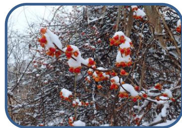
⑤ツルウメモドキの実