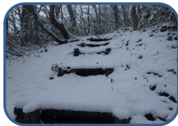
②小谷山探勝路の様子