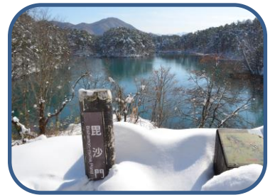
⑤ ビューポイントより