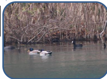
①マガモとオオバン