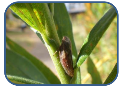
⑤アワフキムシの仲間

裏磐梯ビジターセンター (福島県耶麻郡北塩原村) TEL: 0241-32-2850 開館時間: 9:00~17:00 (4~11月) 休館日: 毎週火曜日 (祝日の場合、翌日が振替休館)