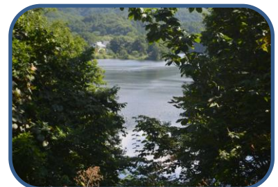
① 探勝路から曾原湖