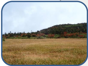
⑦色づき始めた木々と草紅葉