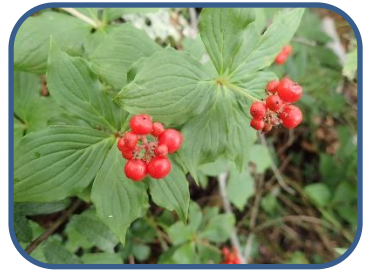
②ゴゼンタチバナの実