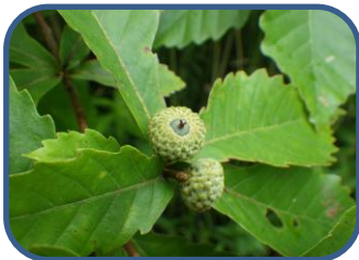
①ミズナラのドングリ

※裏磐梯全域は、ツキノワグマの生息地です。散策の際には、クマ鈴などを準備しましょう。