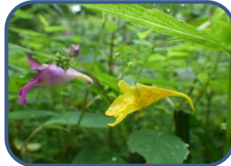
④ツリフネソウとキツリフネ