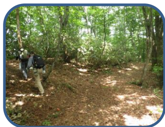
①松原口との分岐点

特徴：松原地区から南に延びる尾根筋を通り、「裏磐梯野鳥の森探勝路」の展望台へ向かうコースです。ブナやミズナラ、トチノキ、カエデなどの広葉樹の森が広がり、樹林のきれたところからは西吾妻山や松原湖の眺望を楽しむことができます。探勝路は、自然(山)の中のコースです。登山のできる用意をしましょう。