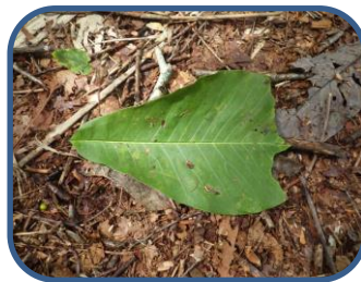
⑤ムササビのものと 思われる食痕