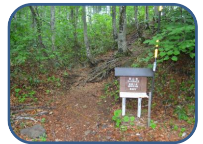
①やまびこ探勝路入口