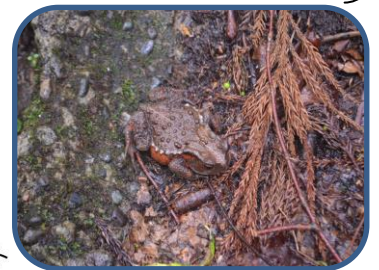
②アズマヒキガエル

ミズナラなどの森の中にある小野川不動滝は、落差約30mの涼しさ満点の美しい滝です。