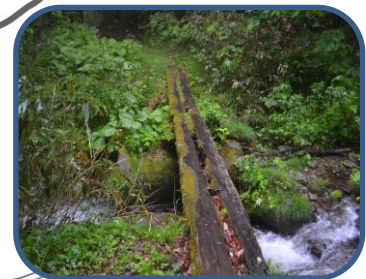
③探勝路には橋が何か所かあります