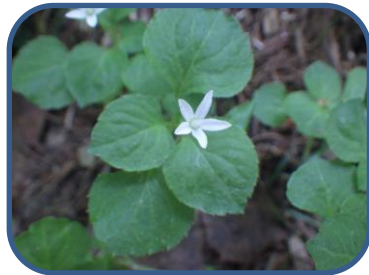
①タニギキョウ ▲雄国山 1271m

特徴：雄国沼を源とする雄子沢川の流れを聞きながら雄国沼へ向かうコース。ブナやミズナラ、カエデなどの広葉樹林の中を緩やかに登ります。探勝路は、自然(山)の中のコースです。山歩きのできる用意をしましょう。