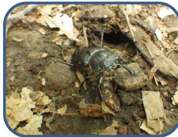
③ミヤマクワガタのメス