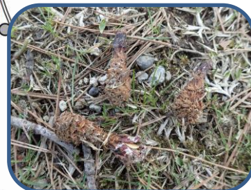
⑤ニホンリスの食痕