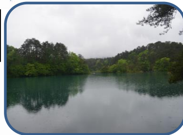
① 残念ながら磐梯山は見えませんでした