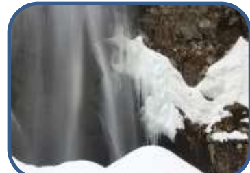
⑦オシドリが時々見られる 不動滝の滝壺