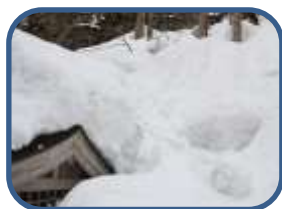
④不動明王の社 周辺の雪