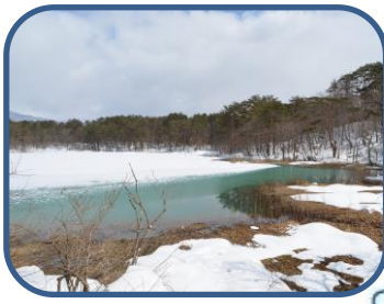
③氷が解け始めた弁天沼