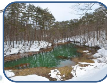
⑤宝石のような赤沼