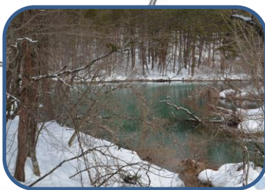
④水の色もきれいな竜沼