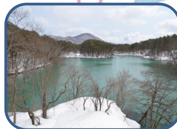
⑥グリーンがきれいな毘沙門沼