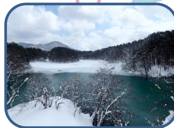
⑥高台から望む毘沙門沼

裏磐梯ビジターセンター (福島県耶麻郡北塩原村) TEL: 0241-32-2850 開館時間: 9:00~16:00 (12~3月) 休館日: 毎週火曜日 (祝日の場合、翌日が振替休館)