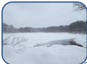
③雪原のような弁天沼