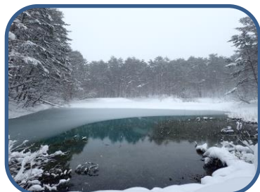
①マツ林のなかに映える青沼