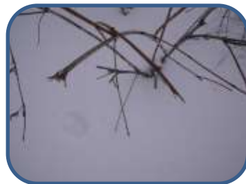
①カモシカと思われる食痕