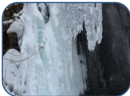
⑥不動滝のブルーアイス 滝の周りや滝壺の氷がうっすら青い色です！

裏磐梯ビジターセンター(福島県北塩原村) TEL:0241-32-2850 開館時間:9:00-16:00(12月~3月) 休館日:毎週火曜日(祝日の場合、翌日が振替休館)