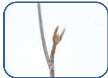
④オオカメノキの芽