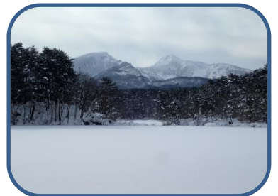
④雪原になった毘沙門沼東部