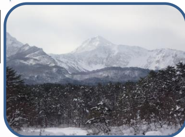
③くっきりと見えた磐梯山