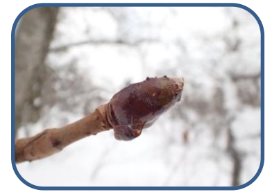
⑦ネバネバしたトチノキの冬芽

裏磐梯ビジターセンター (福島県耶麻郡北塩原村) TEL: 0241-32-2850 開館時間: 9:00~16:00 (12~3月) 休館日: 毎週火曜日 (祝日の場合、翌日が振替休館)