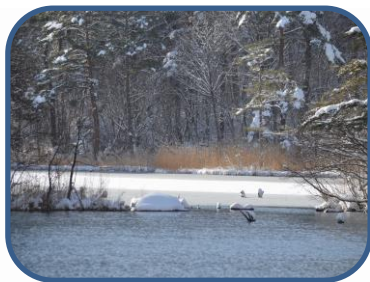
③ 雪化粧の毘沙門沼