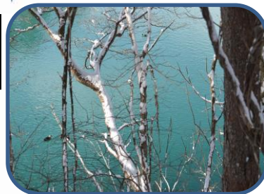
④ 神秘的な色の 毘沙門沼