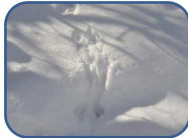
⑥ 二ホンリスの足跡